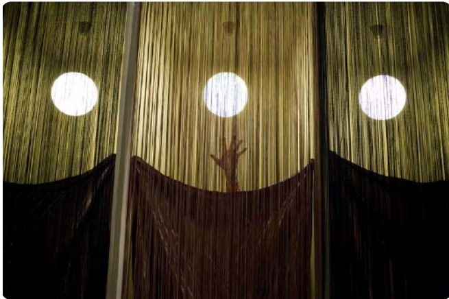
© Radu Andrei - Danseur - 2006