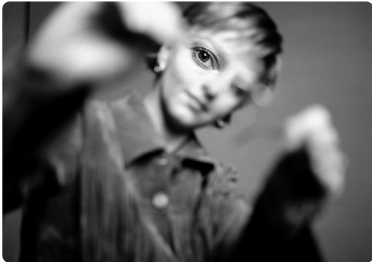
© Andreea Godeanu - Productrice TV - 2004

Galerie Agent Double @ Crossroads - 7 rue Chappe - 75018 Paris Métro : Anvers (ligne 2) ou Abbesses (ligne 12)