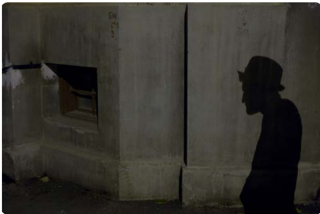
© Smileq - Chanteur - 2007